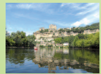
Le village de Beynac