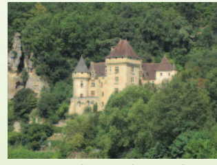
Château de La Malartrie