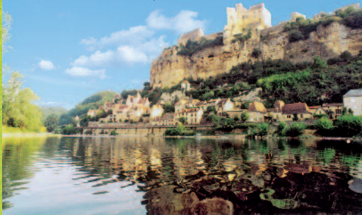
Arrivée au cœur de Beynac

Ces prix comprennent : le matériel de navigation, le gilet d'aide à la flottabilité, le transport, la R.C. - Prices including navigation material, buoyancy aid and safety aid, transport, R.C.