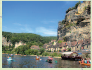
La Roque Gageac