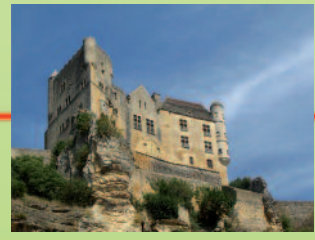
Le château de Beynac